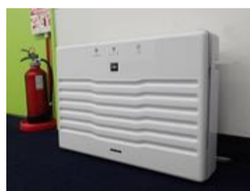
空気消臭除菌装置